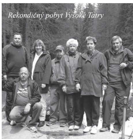
Rekondičný pobyt Vysoké Tatry

- Pravidelne navštevujeme našich členov počas ich hospitalizácie.