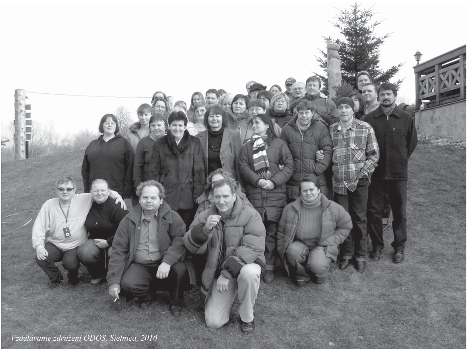
Vzdelávanie združení ODOS, Sielnica, 2010