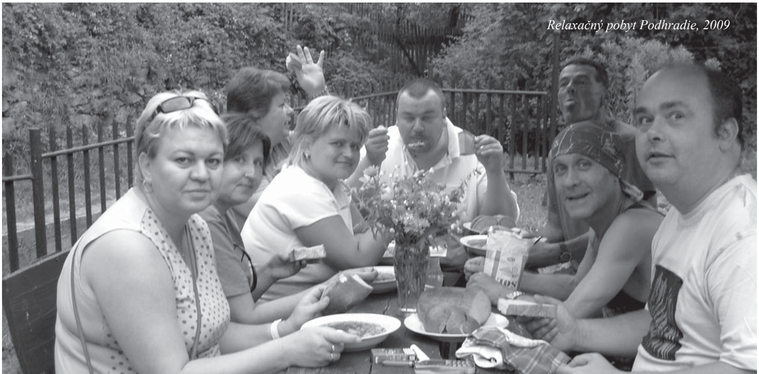
Relaxačný pobyt Podhradie, 2009