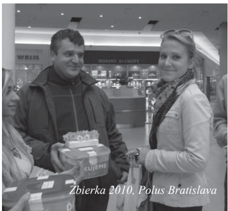
Zbierka 2010, Pohus Bratislava

V polovici októbra 2010 sa už 7. rok konala verejná zbierka organizovaná Ligou za duševné zdravie v spolupráci s ODOS, materskými centrami a ďalšími koordinátormi z radov členských združení Ligy alebo z radov dobrovoľníkov. Všetci sme s napätím sledovali predpo-