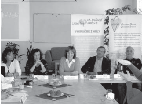
Tlačová konferencia v rámci začatia kampane LDZ 2010

Začiatkom októbra už tradične organizovala Liga za duševné zdravie SR (LDZ) v spolupráci s ODOS jesennú kampaň a verejnú zbierku na podporu duševného zdravia na Slovensku. Kampaň a zbierka boli zamerané, tak ako vlani,