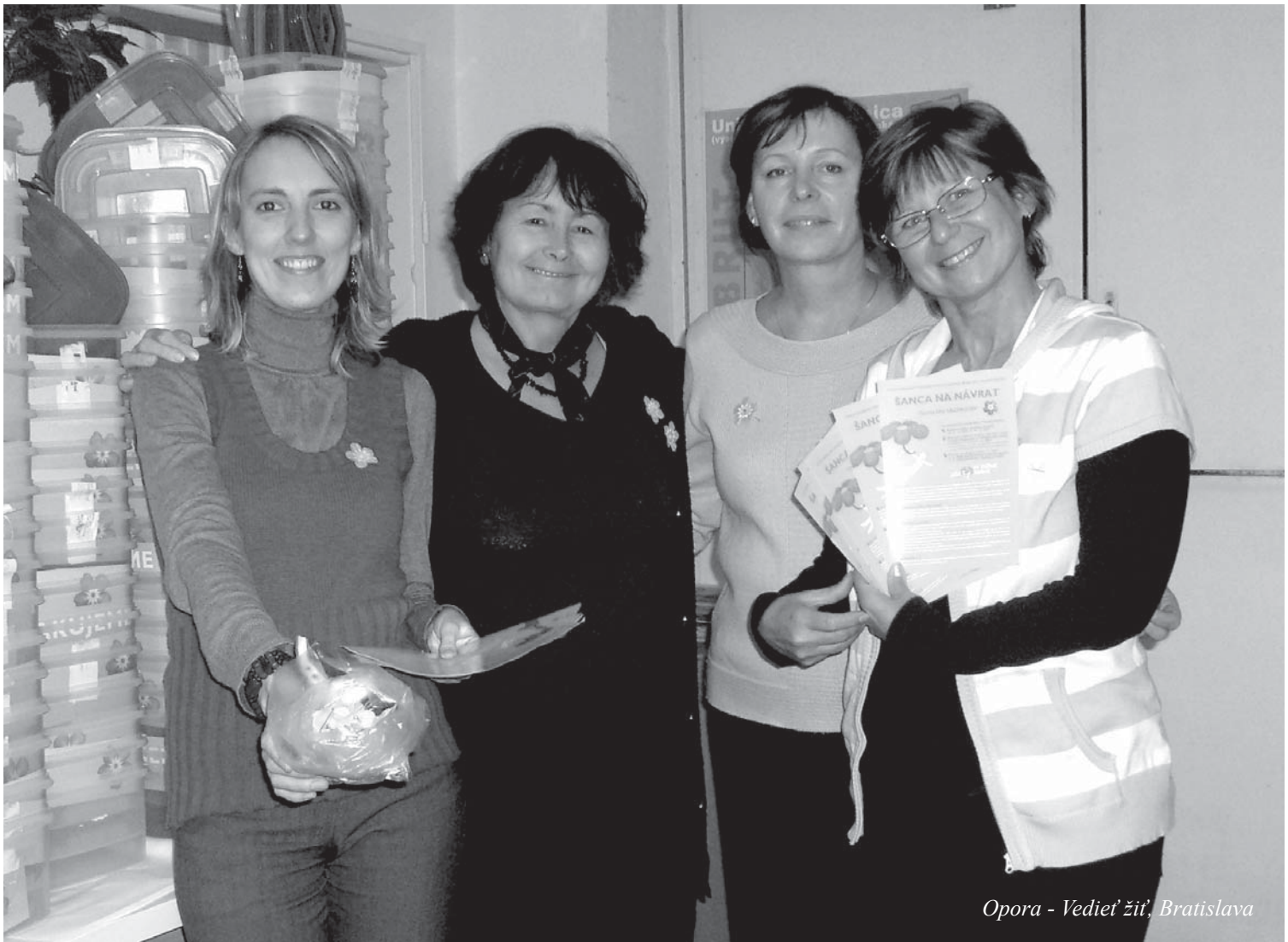
Opora - Vedieť žiť, Bratislava

zasluhujú veľkú pozornosť. Je to neľahká skúsenosť, ktorá prináša do rodiny rozmanité negatívne pocity ako hnev, smútok, pocity viny, hanby, zmätok... Často je to nečakaný zásah do života každého člena rodiny, s ktorým sa doma učíme žiť... Do centra pozornosti sa dostáva starostlivosť o nášho blízkeho. Schopnosť pomáhať na jednej strane ale zároveň si dokázať vytvoriť priestor pre seba na strane druhej je dôležitým prvkom zvládania tejto životnej situácie. V konečnom dôsledku táto schopnosť vedie k pozitívnemu ovplyvneniu emocionálnej atmosféry vo vzájomnom vzťahu. Preto chceme ponúkať tento osobitný priestor pre príbuzných aj pacientov, kde môžu otvorene hovoriť o svojich emóciách, skúsenostiach, obavách a nádejach a zdieľať ich s ľuďmi, ktorí sa ocitli v podobnej životnej situácii. Veľmi cenné a obohacujúce je aj to, keď sa príbuzní a pacienti navzájom môžu zrazu pozrieť na problém aj očami toho druhého.