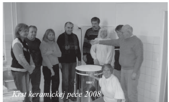
Krst keramickej pece 2008

pre žiakov miestnych škôl. V našej keramickej peci ponúkame možnosť vypaľovania a glazovania keramických výrobkov (prvé keramické predmety sme finalizovali v januári 2008), najmä žiakov zo spolupracujúcich škôl. Máme aj iné kreatívne aktivity a vďaka šikovným rukám našich členiek vznikajú úžitkové predmety z vlny a textilu, ktoré sa nám darí predávať na výstavách našich výrobkov počas roka.