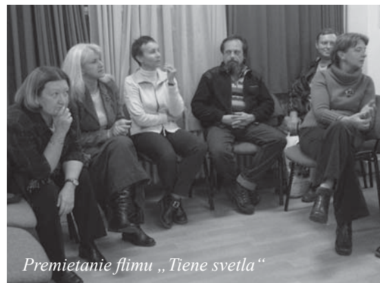
Premietanie filmu „Tiene svetla“

Naše občianske združenie Krídla vzniklo v roku 1999. Zriadili sme štvrté rehabilitačné centrum (s podporou BSK) na Slovensku, ktoré umožňuje podporovať tvorivosť, fantáziu a originalitu prejavu ľudí s duševnou poruchou v širokom zábere činností - rozmanité výtvarné techniky, tvorba v literárnej, dramatickej a mediálnej oblasti, práca s hlinou a paličkovanie. Rozvíja u pacientov telesnú zdatnosť formou cvičení a organizovaním turistických výletov. Umožňuje im zúčastniť sa hipoterapie a petterapie.