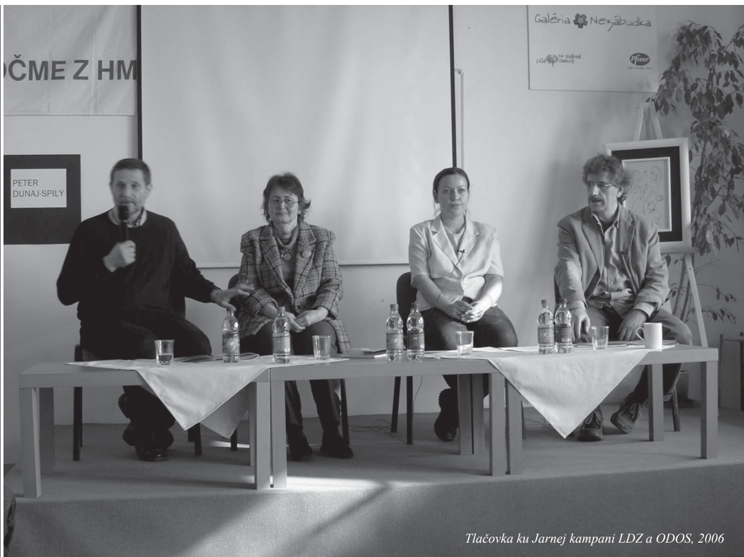
Tlačovka ku Jarnej kampani LDZ a ODOS, 2006

tóber 2003) a slovenskú premiéru počas jarnej kampane ODOS v Auparku v Bratislave (apríl 2004). Mediálna skupina postupne prešla od zaznamenávania miestnych aktivít členov v Michalovciach ku dokumentovaniu podujatí aj v iných členských združeníach ODOS v rámci celého Slovenska a ako prví založili tradíciu archivácie činnosti združení ľudí s duševnými poruchami..