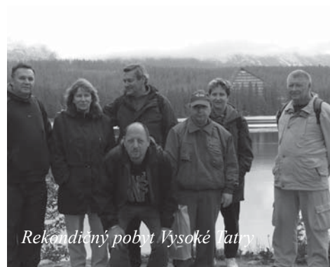
Rekondičný pobyt Vysoké Tatry