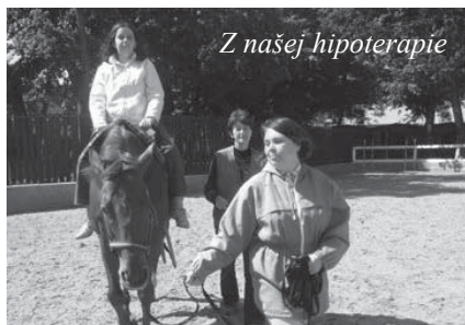
Z našej hipoterapie

Rozširuje ich obzor poriadanimi poznávacích zájazdov do okolia Bratislavy aj za hranice Slovenska. Združenie v rámci Rehabilitačného strediska v Bratislave poskytuje sociálne poradenstvo ľuďom s duševnou poruchou a ich rodinným príslušníkom. Vystupovaním v médiách prispieva ku destigmatizácii ľudí s duševnými poruchami a ku zmene negatívnych postojov verejnosti k tejto skupine ľudí.