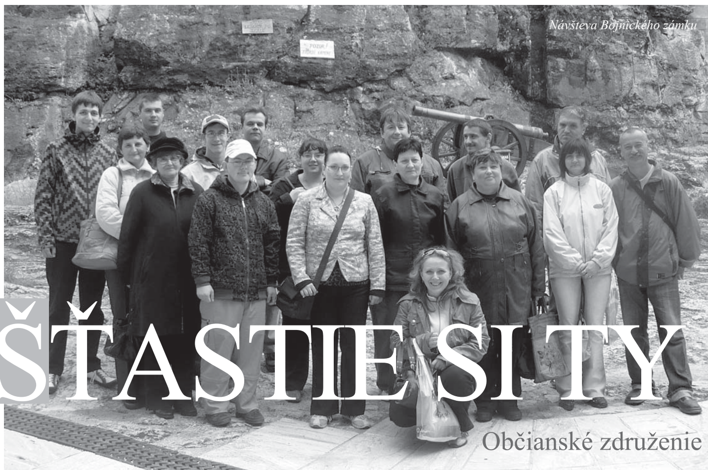
Návšteva Bojnického zámku