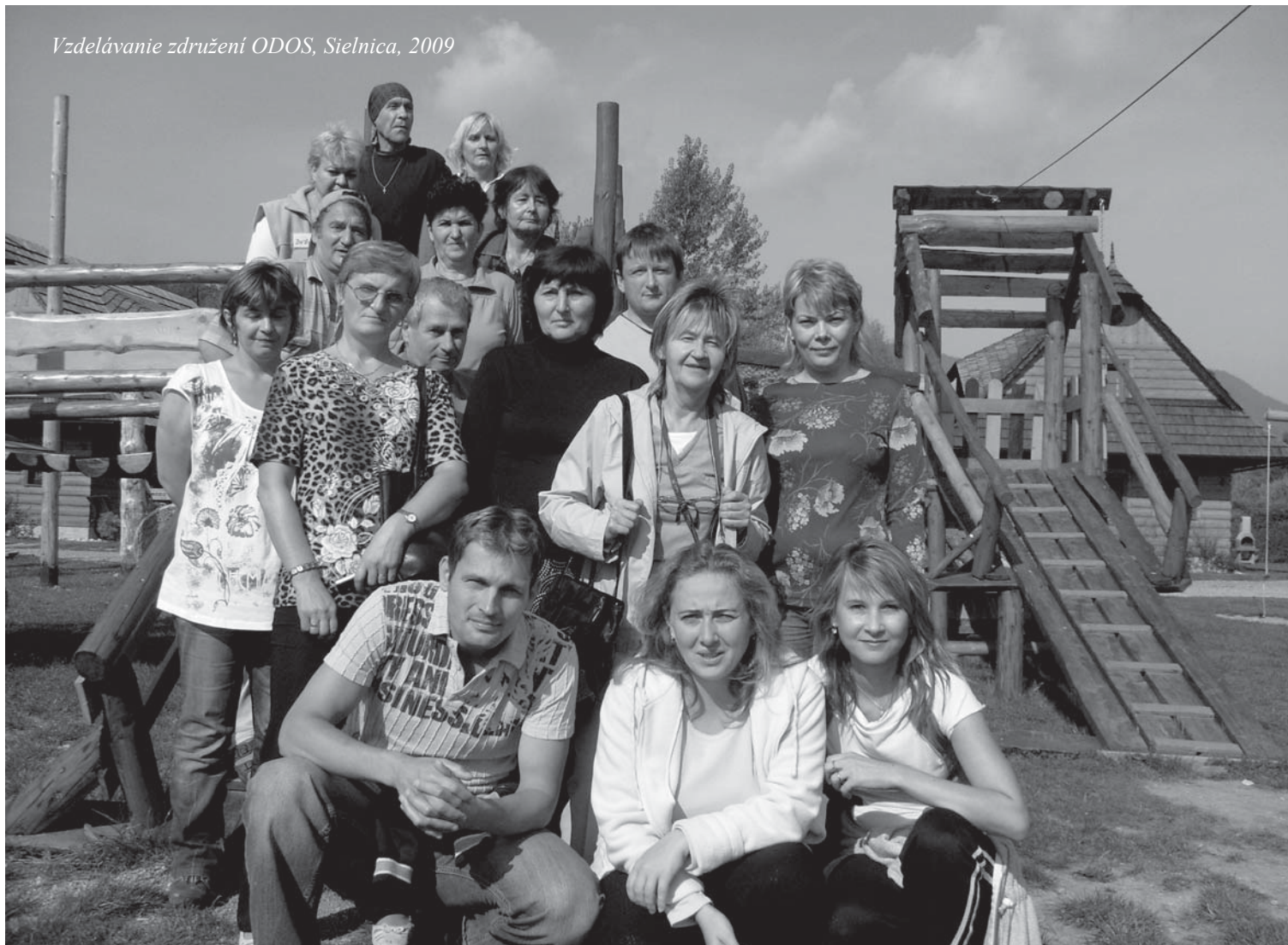
Vzdelávanie združení ODOS, Sielnica, 2009