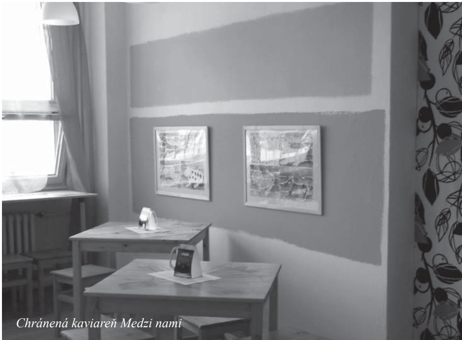
Chránená kaviareň Medzi nami

Chránená kaviareň Medzi nami predstavuje miesto pre pracovné uplatnenie ľudí s duševnou poruchou. Poskytuje pracovné podmienky primerané zdravotnému stavu pracovníkov, individuálny prístup a podporu pracovného asistenta. Služi k tréningu zvládania pracovnej záťaže, k náviku praktických zručností a adaptácie na pracovný kolektív. Pracovníkov vedie k samostatnosti, schopnosti rozhodovať sa a k zodpovednosti.