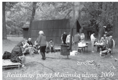
Relaxačný pobyt, Manínska úžina, 2009

- Organizujeme každý týždeň v piatok tvorivé dielne s rôznym zameraním aktuálne podľa záujmu zúčastnených členov. Vytvárame drobné dekoratívne a úžitkové predmety, ktoré ponúkame prednostne našim členom ale robia radosť aj v rámci výstav. Tradične sa nimi inšpirujú k ich