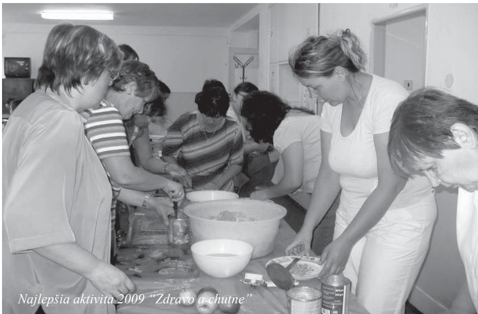
Najlepšia aktivita 2009 "Zdravo a chutne"

- Realizujeme projekt Chránené dielne z prostriedkov EÚ a štátneho rozpočtu podporený ÚPSVaR. Je zameraný na tri chránené pracoviská. Náplňou projektu je administratívna činnosť združenia, sprostredkovanie osobnej asistencie pre jednu našu členku, pričom každý mesiac spracúvame i administratívne záležitosti ohľadne tejto služby.