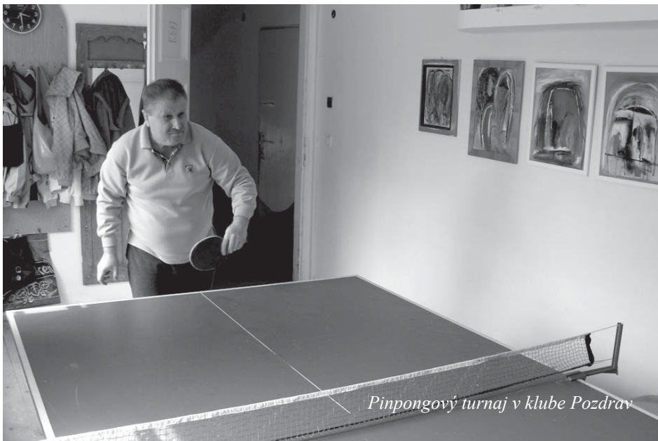
Pinpongový turnaj v klube Pozdrav

val v činnosti v rámci projektu ODOS „Pacientská advokácia - nástroj znižovania stigmy u ľudí s duševnou poruchou. Aktivity PA robíme naďalej aj v roku 2010 ale v menšej intenzite.