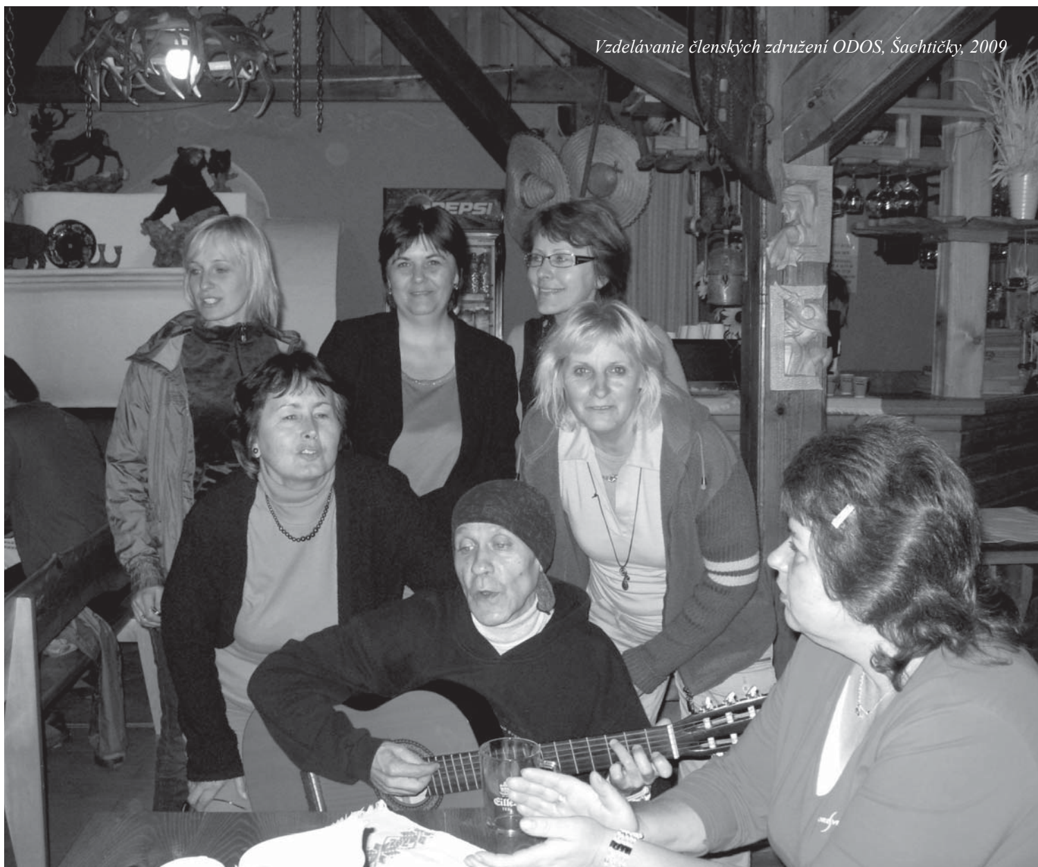
Vzdelávanie členských združení ODOS, Šachtičky, 2009

- Každoročná aktívna účasť na celoslovenských jesenných kampaniach Ligy za duševné zdravie SR. ODOS počas zbierky koordinuje svoje členské združenia v regiónoch Slovenska. Zástupcovia ODOS sa aktívne účastňujú na diskusiách s verejnosťou v regiónoch a vystupuje v národných a regionálnych médiách. Pomáha tak meniť postoje verejnosti k ľuďom s duševnými problémami čo zlepšuje sociálne začleňovanie duševne chorých späť do spoločnosti.