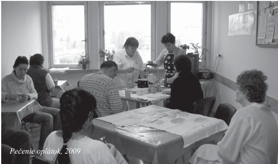
Pečenie oplátok, 2009