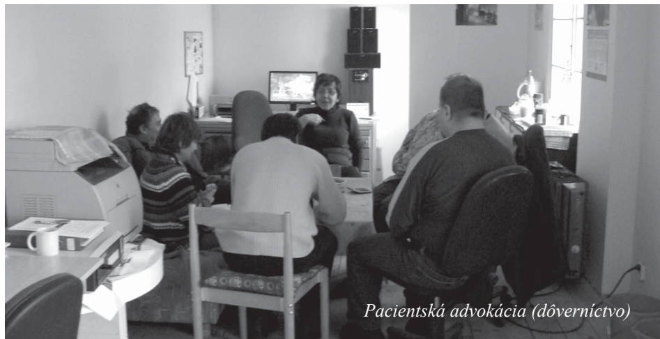
Pacientská advokácia (dôvernictvo)

Členovia združenia sa stretávajú v miestnosti Pozdrav každý deň v čase od 9.00 - 16.00 hod.