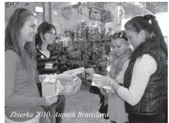
Zbierka 2010, Aupark Bratislava

noch 17 180,85EUR (TAB.1) a v Bratislave 5 764,72EUR (TAB.2) Čo sa týka miest (TAB.3), vyzbierali členské združenia ODOS najviac v Košiciach (3 019,61EUR, tu zbierali 3 združenia) potom v Žiline (2 668,20EUR), v ktorej zbieralo iba 1 združenie a v Partizánskom (2 289,59EUR).