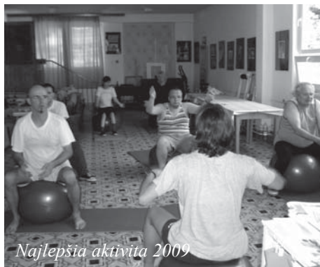
Najlepšia aktivita 2009

- Venujeme sa pravidelnej vydavateľskej činnosti . Od roku 2006 vydávame časopis Delfin zvolenský , s finančnou podporou Ministerstva kultúry SR a v poslednom roku aj MPSVR SR. Uvedený mesačník pre duševné zdravie má od apríla 2010 regionálnu pôsobnosť. Je distribuovaný pacientom na Psychiatrickom oddelení NsP vo Zvolene, do psychiatrických a psychologických ambulancií v regióne, partnerským združeniam na Slovensku a našim sponzorom a priaznivcom. V časopise prezentujeme aktuálny život nášho združenia. Prispievajú doň